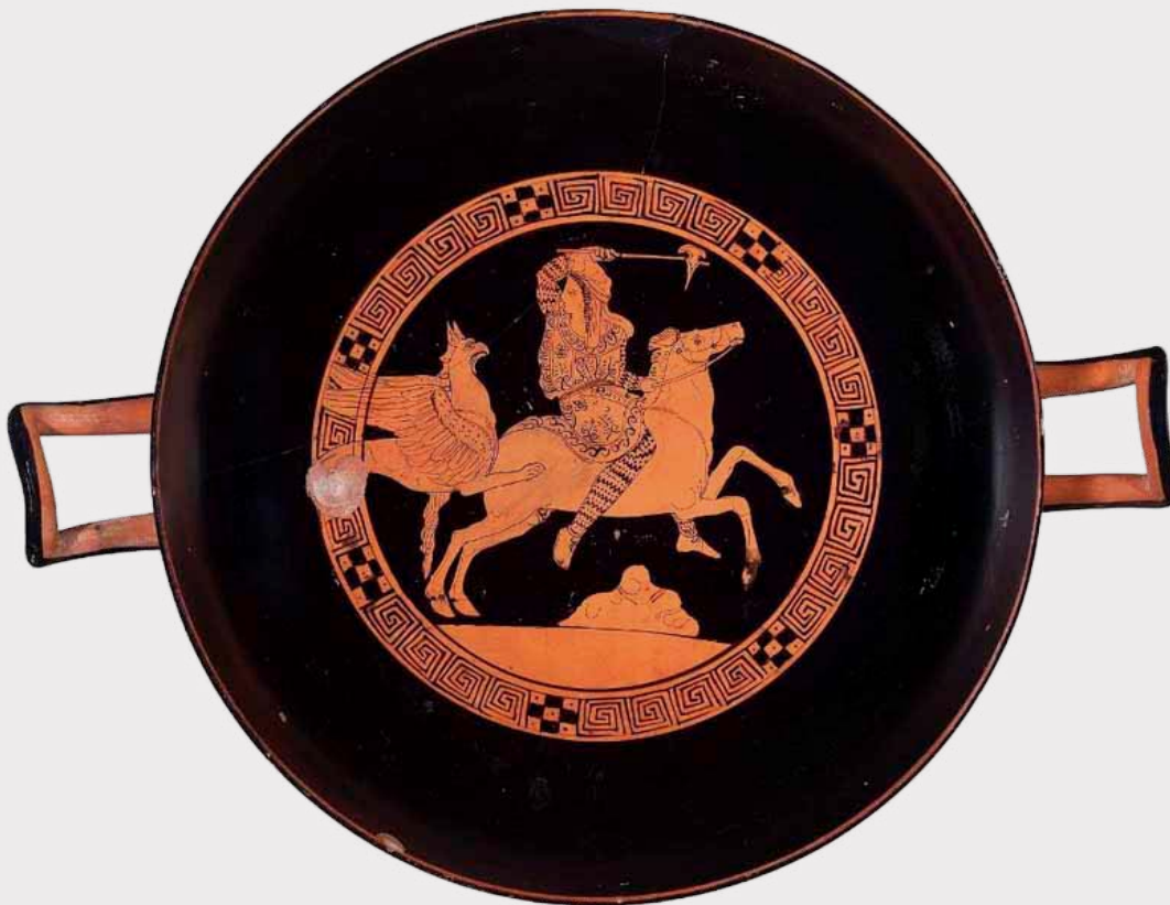
Amazona montada con un hacha puntiaguda combatiendo contra un grifo en un paisaje desolado. Kylix (copa para beber) de figuras rojas, siglo IV a. C., pintor de Jena, Museum of Fine Arts, Boston, Henry Lillie Pierce Fund, 01.8092.

Y es que, el caballo, fue el gran nivelador entre los hombres y las mujeres de las estepas, entranando posiblemente una de las principales razones de la proverbial igualdad de género que caracterizaba a las gentes nómadas. Gracias a los équidos, una arquera montada con cierta habilidad podía cuidarse por sí misma en el combate, aunque hubiera de enfrentarse a guerreros varones. La posibilidad de cabalgar liberaba a las mujeres y les otorgaba autonomía de movimientos y una estimulante y desafiante vida en la naturaleza. Entre los griegos, solo los varones gozaban de semejante independencia física al aire libre, en tanto que las mujeres, idealmente, debían