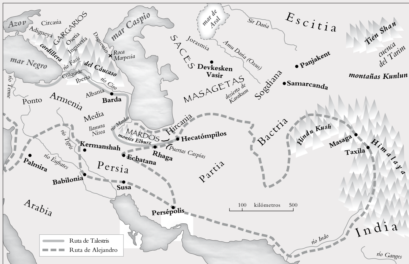
Itinerarios de Alejandro y Talestris. Mapa de Michele Angel.

deseo de visitar al rey», partió de sus tierras con una gran escolta. Cuando se aproximaba al campamento macedonio, la amazona envió por delante a sus emisarios para «dar noticia de que la reina deseaba conocer al rey y familiarizarse con él». Al punto Alejandro dio su permiso. Talestris cabalgó al interior del campamento, junto con un cortejo de trescientas mujeres, y dejó atrás al resto de sus fuerzas; a su llegada, ofreció a Alejandro magníficos regalos, como unos dorados atalajes para Bucéfalo o una capa de lana con escamas de oro para el propio monarca.