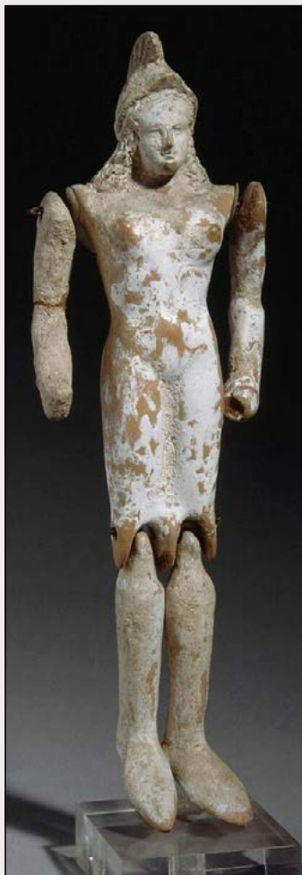
Muñeca de terracota de amazona con casco y brazos y piernas articuladas. Siglo V a. C., Egina, inv. CA955, Musée du Louvre, París.

En definitiva, la secuencia más plausible sería esta: los griegos arcaicos oyeron hablar de unas gentes que moraban en torno al mar Negro y las estepas que lo circundaban; una sociedad guerrera caracterizada por un notable grado de igualdad entre los sexos. Su nombre no griego, que sonaría a algo parecido a «amazonas», se adaptó dando lugar en la literatura épica al etnónimo amazonas . El epíteto antianeirai se añadió para remarcar la característica más notable de este grupo, su igualdad entre géneros, y se optó por reflejarlo en femenino para enfatizar el elevado estatus del que gozaban las mujeres en esta tribu particular, en relación sobre todo con la posición social que caracterizaba a las mujeres en la cultura griega. Al con-