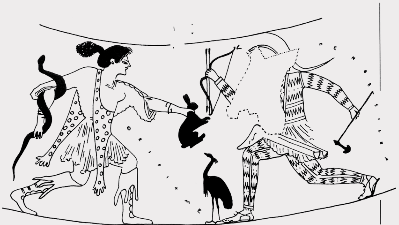
Cazadora tracia cortejando a la amazona Penthesilea. Alabastrón de fondo blanco, pintor de Pasiades, ca. 525-500 a. C. Dibujo a partir del original conservado en el Ethnikó Archaïologikó Mouseío [Museo Arqueológico Nacional], Atenas.

El sexo con las amazonas era vigoroso, promiscuo. Tenía lugar al aire libre, fuera del matrimonio, habitualmente en la estación estival y en él tomaba parte cualquier varón que una amazona hubiera elegido para emparejarse. Algunos especialistas modernos interpretan estos detalles de las antiguas fuentes griegas como una reversión imaginaria de la vida hogareña ortodoxa de las confinadas mujeres griegas; una imagen reflejada en un espejo distorsionado inventado por los varones