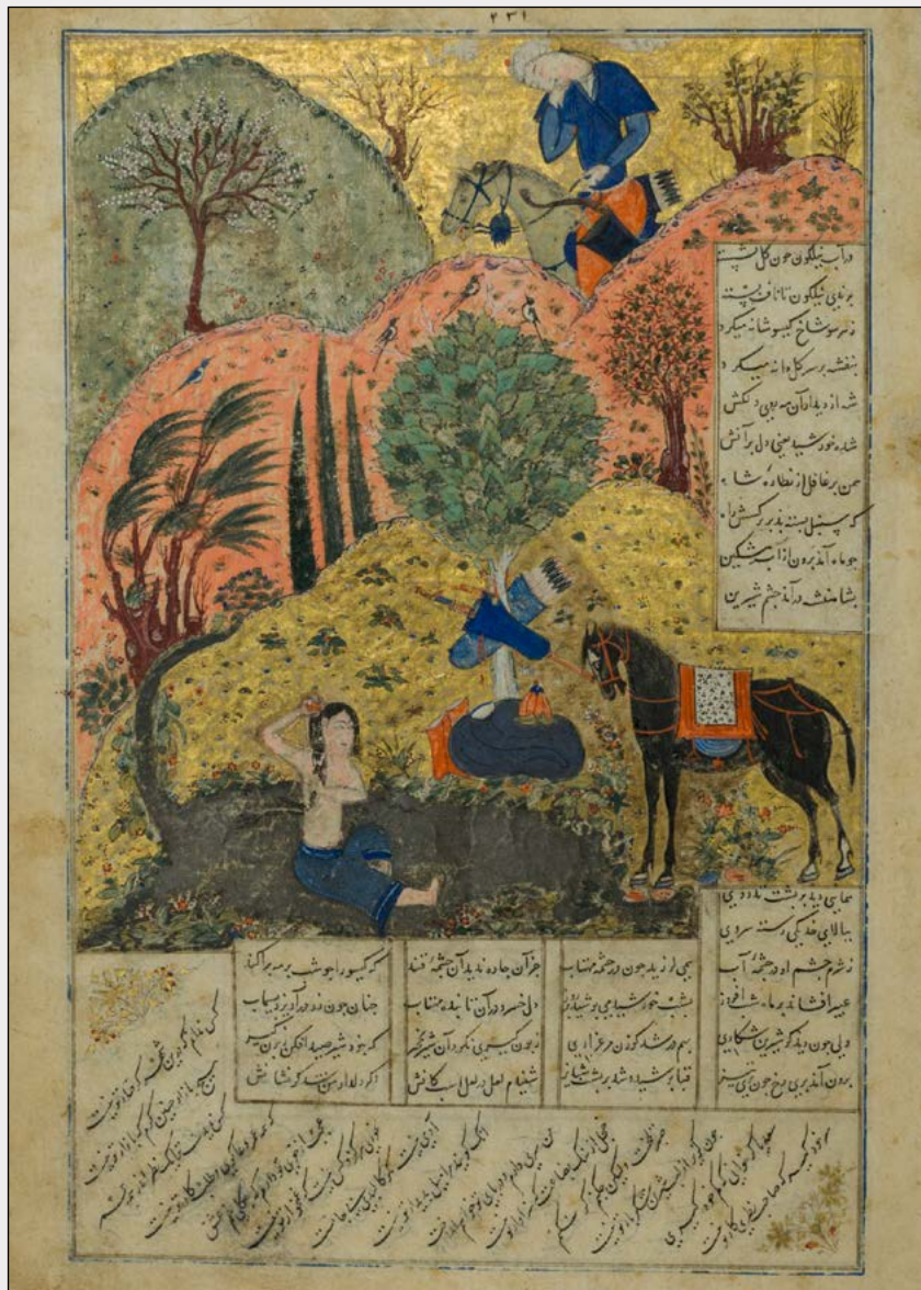
Cosroes divisa a Shirin bañándose. Su carcaj, arco y espada cuelgan de un árbol. Miniatura del Khamsa de Nizami , ca. 1420. Inv. I. 4628, S. 231, Museum für Islamische Kunst, Staatliche Museen, Berlín, bpk, Berlín/ Staatliche Museum/Art Resource, Nueva York.

traducidas del circasiano, el ingusetio y el lak; a partir de las leyendas y poemas épicos de Armenia y Azerbaiyán; a partir de un tratado militar grecorromano; y a partir de los recuentos que los primeros viajeros europeos redactaron sobre las historias que escucharon en la región. Algunos de estos relatos son míticos. Otros, como las historias de Tirgatao y Amage preservadas por Polieno, se refieren a acontecimientos históricos y a individuos que griegos y romanos consideraron de especial interés. Otros, finalmente, describen la vida de ciertos jinetes, cazadores, pastores, saqueadores, luchadores, amantes y líderes que resultaban ser mujeres: las hermanas esteparias de las mujeres enterradas junto con sus armas y caballos en los yacimientos dispersos por toda Escitia.