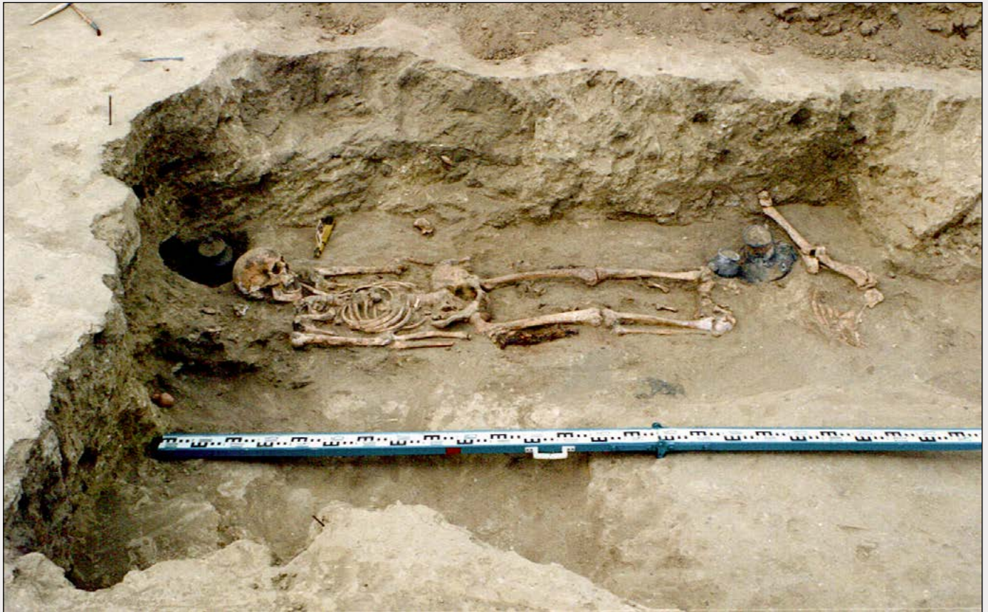
Esqueleto de guerrera, con un gran puñal de hierro en su mano derecha y dos puntas de flecha de hierro entre las piernas, siglos V-IV a. C., necrópolis 8, kurgán 1, enterramiento 6. Abajo, detalle del puñal junto al fémur. Fotografías de James Vedder, Center for the Study of Eurasian Nomads, 1992.

heridas de guerra. Algunos especialistas han sugerido que en las tumbas femeninas las armas se depositaron tan solo por razones rituales, como por ejemplo la protección simbólica de las difuntas en el Más Allá. Pero los arqueólogos aducen que la presencia de heridas de guerra en los esqueletos constituye un argumento de mayor peso para defender que las mujeres enterradas con armas fueron genuinas guerreras. En ocasiones, las puntas de flecha aún permanecen incrustadas en los huesos, como sucedía con la mujer guerrera de Tiras que antes mencioné. Un buen número de huesos y cráneos de hombres y mujeres guerreros muestra terribles lesiones infligidas por las puntiagudas hachas de guerra ( sagareis ), tajos de espada, heridas penetrantes ocasionadas por puñales y lanzas y perforaciones provocadas por proyectiles. En muchos casos, la trayectoria del ataque resulta evidente, de modo que algunos huesos también nos revelan si sus lesiones se produjeron en mitad de un combate cuerpo a cuerpo o durante una huida a caballo, o si se trata de laceraciones post mortem . La consiguiente descripción de las heridas evoca escenas de violentas batallas y duelos. Sin ir más lejos, un estudio de los esqueletos de un varón y una mujer escitas con heridas en la cabeza provocadas por hachas de guerra ( vid. infra , detalladas) demostró que la mayor parte de los impactos fueron